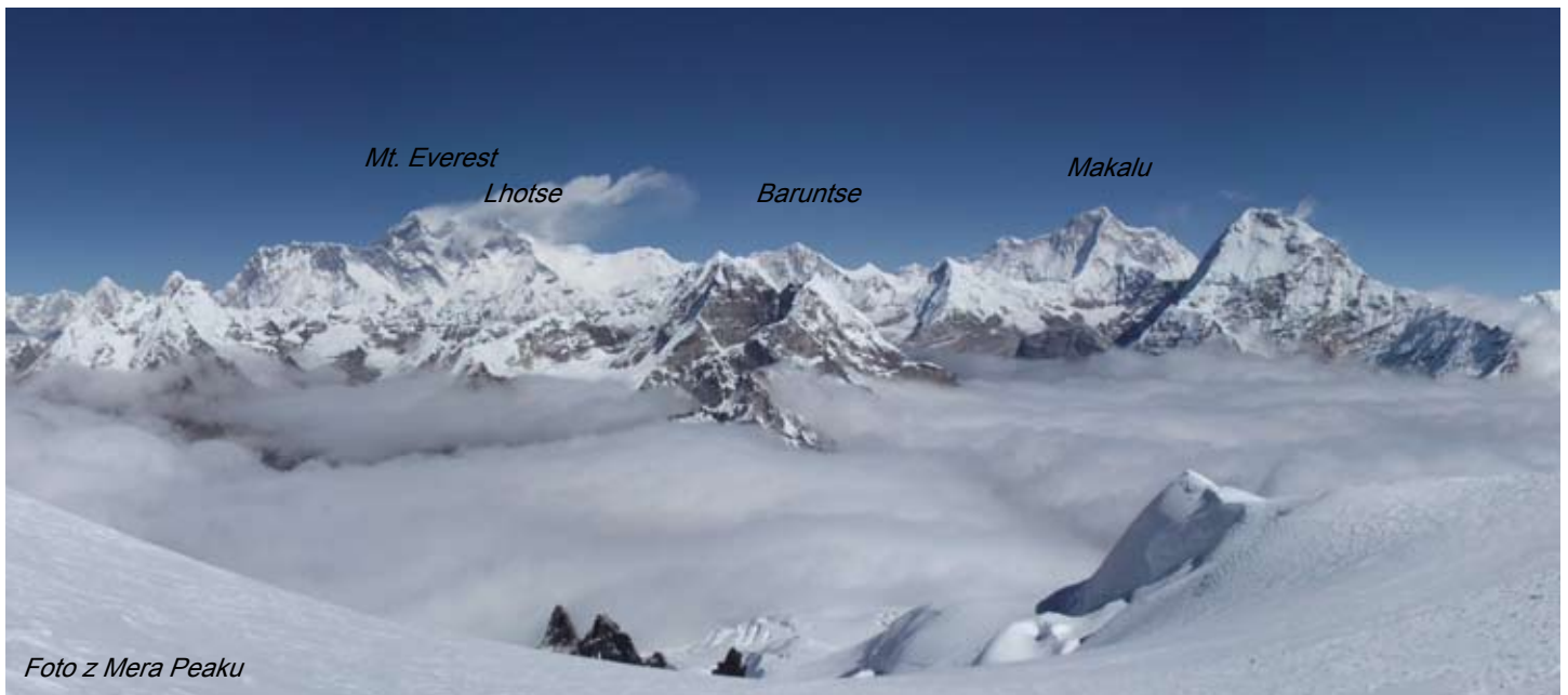
Foto z Mera Peaku