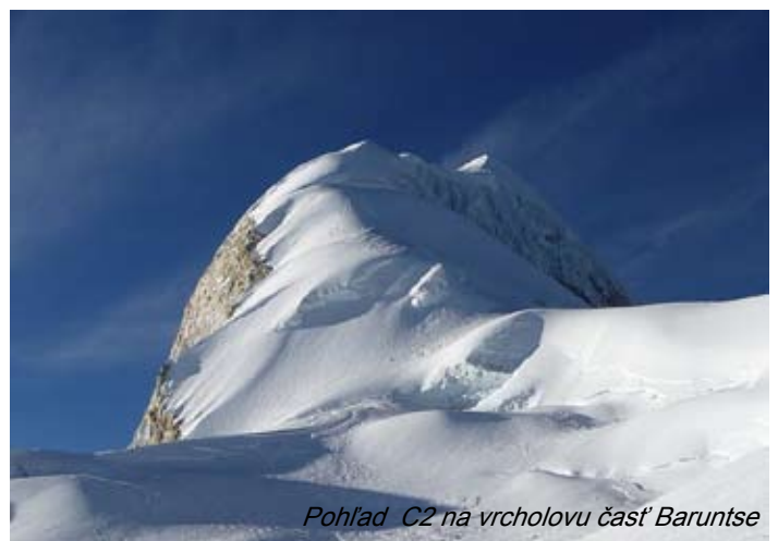
Pohľad C2 na vrcholovu časť Baruntse