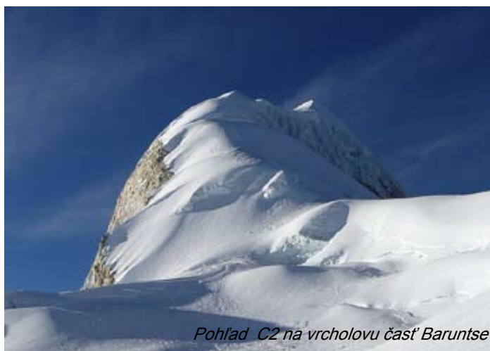
Pohľad C2 na vrcholovu časť Baruntse