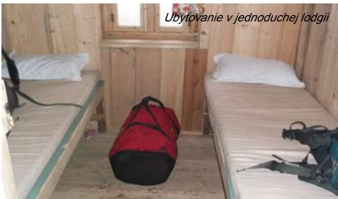
Ubytovanie v jednoduchej lodgii