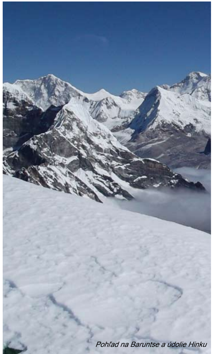
Pohľad na Baruntse a údolie Hinku

Na treku v miestnych chatách je takisto možnosť dobitia bateriek elektrikou zo solárnych panelov a malých vodných elektrární, domáci si niekedy účtujú poplatok za nabíjanie 100 až 300 rupií (cca 1 až 3 EUR).