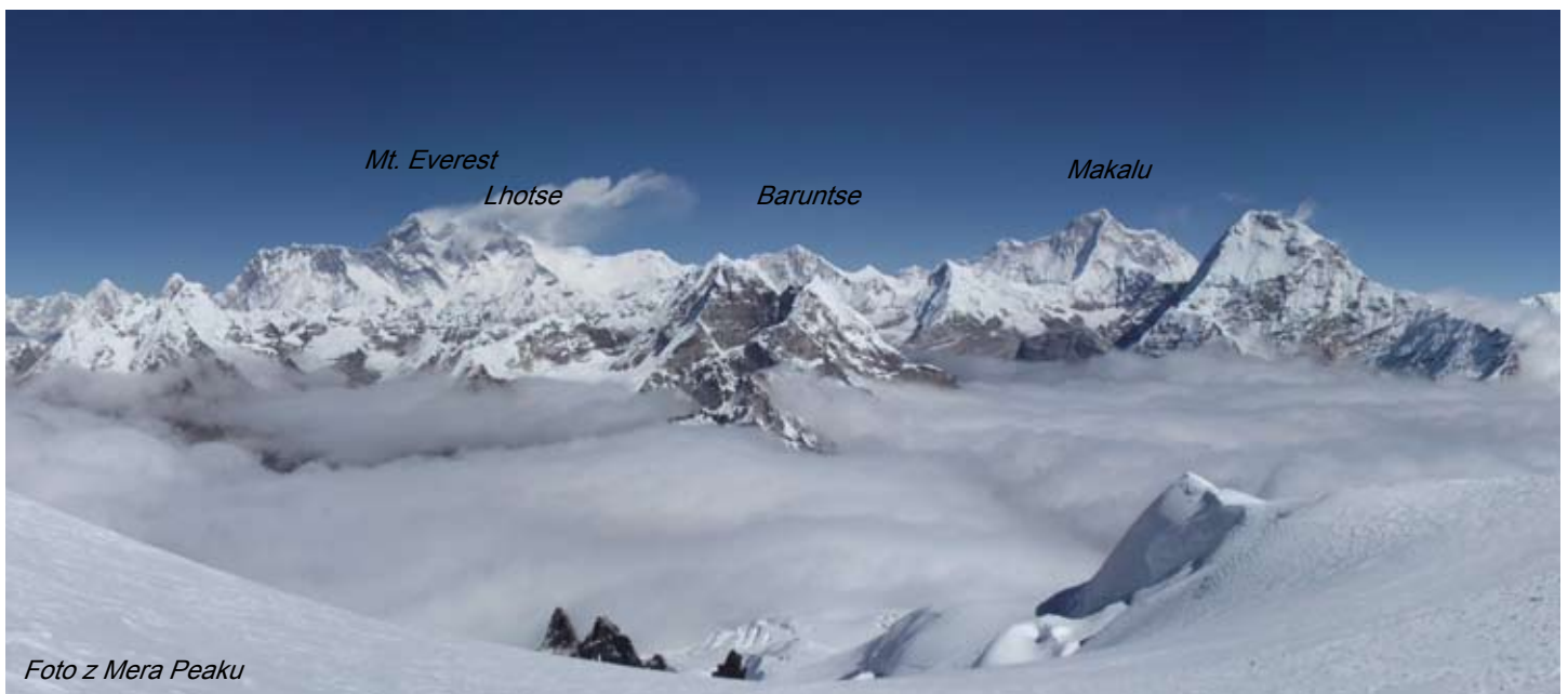
Foto z Mera Peaku