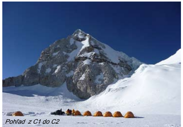
Pohľad z C1 do C2