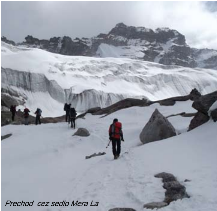
Prechod cez sedlo Mera La

Pri výstupe na Baruntse treba rátať s dennou a nočnou teplotou -5 až -30 stupňov celzia.