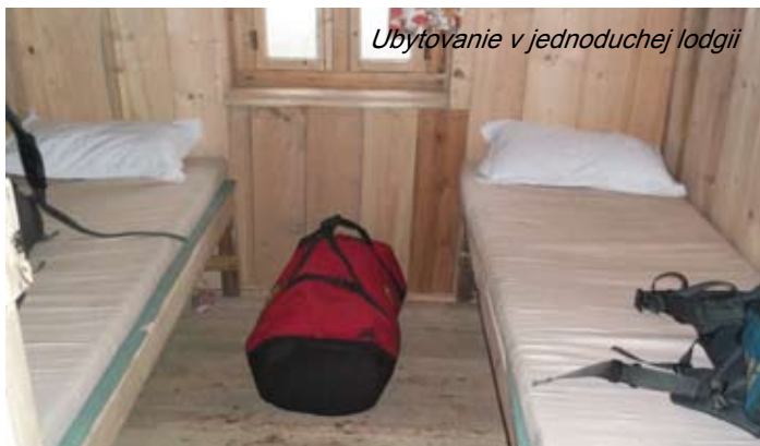
Ubytovanie v jednoduchej lodgii