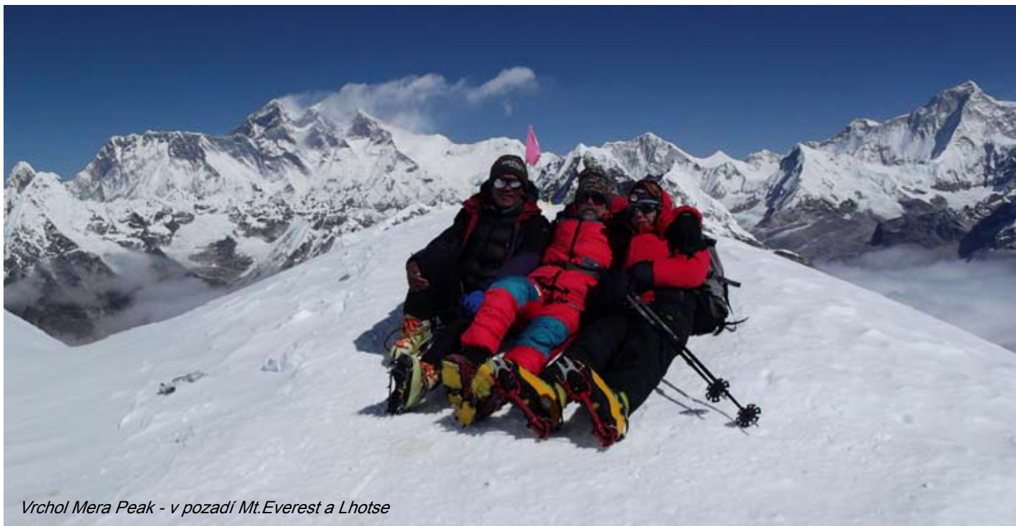
Vrchol Mera Peak - v pozadí Mt. Everest a Lhotse

Okrem fotiek na víza je nutné mať so sebou ďalších 8 ks fotografií pasového formátu na povolenia, 2 krát prefotenú stránku z cestovného pasu (stránka s vašimi údajmi a fotkou), 40 USD v hotovosti na nepálske víza a 2 krát prefotené kartičky poistenia.