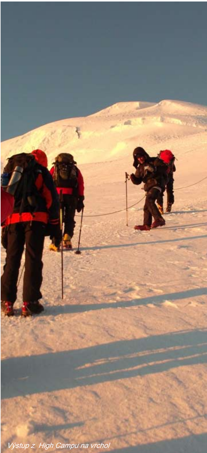
Výstup z High Campu na vrchol