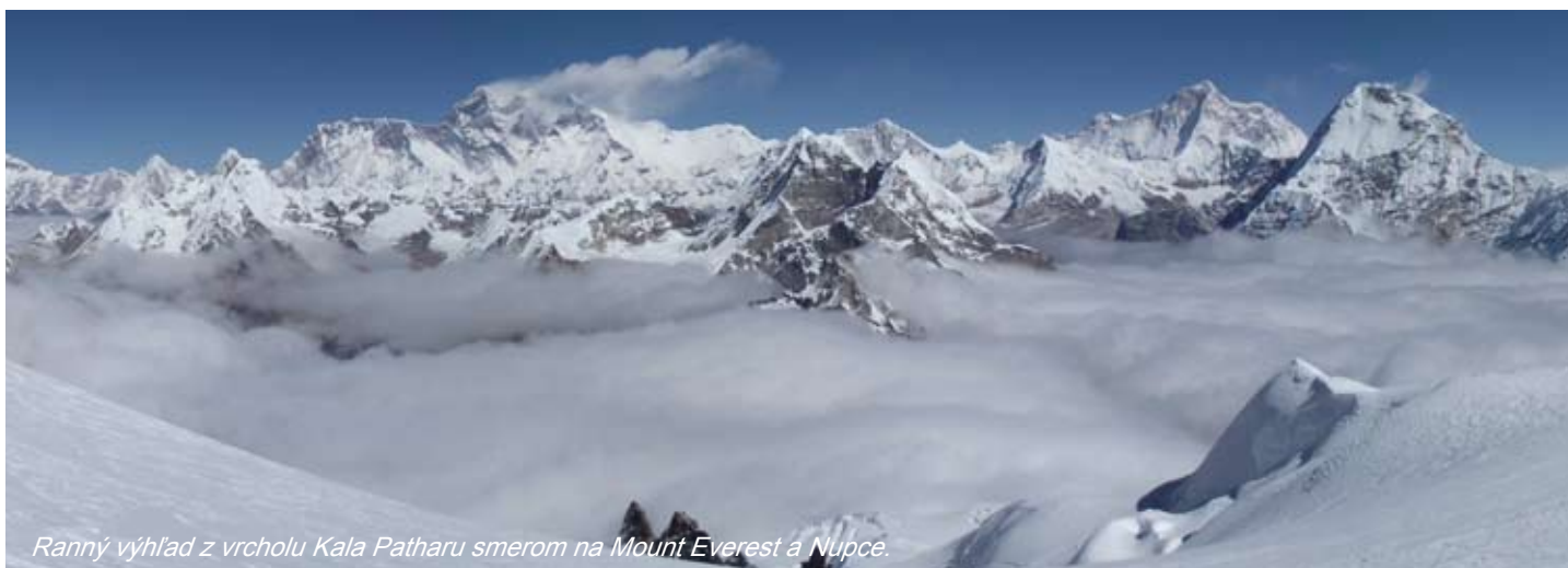
Ranný výhľad z vrcholu Kala Patharu smerom na Mount Everest a Nupce.