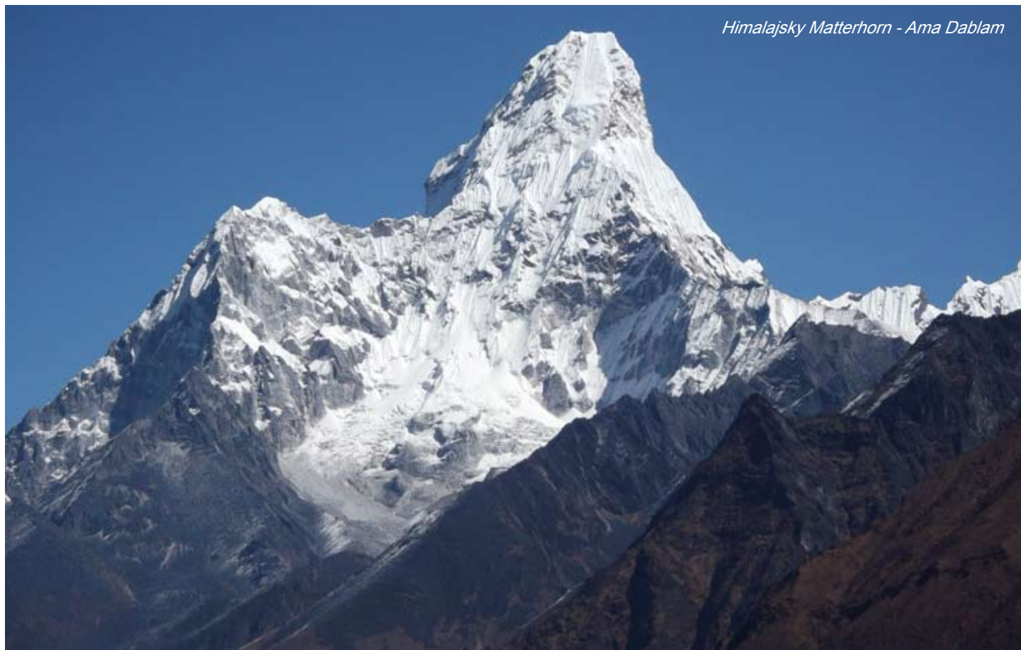
Himalajsky Matterhorn - Ama Dablam

Lekárne sú však dobre vybavené. Súkromné zdravotnícke zariadenia majú prijateľnejšiu kvalitu - vyžadujú však zaplatenie lekárskej služby hneď po ich poskytnutí preto je vhodné mať pri sebe hotovosť. Pri obmedzenom množstve finančných prostriedkov je možné požiadať o ošetrovanie v štátnych nemocniciach, avšak ich úroveň zďaleka nedosahuje európsky štandard.