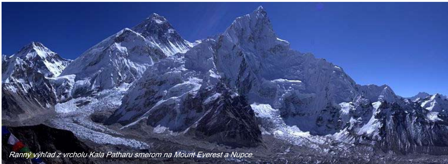
Ranný výhľad z vrcholu Kala Patharu smerom na Mount Everest a Nupce.

Najznámejší trek v Himalájach nás zavedie po chodníkoch šerpov až do základného tábora pod najvyššiu horu sveta, pod majestátny 8 848 metrov vysoký Mount Everest .