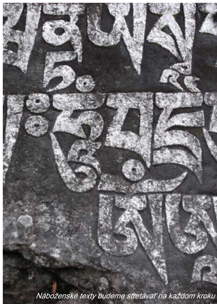
Náboženské texty budeme stretávať na každom kroku

Elektrické napätie i zásuvky sú rôzne, ale vždy aspoň jedna rovnaká ako u nás, nebudete teda potrebovať žiadne špeciálne zariadenia alebo adaptéry na nabíjanie mobilu, prípadne fotoaparátu.