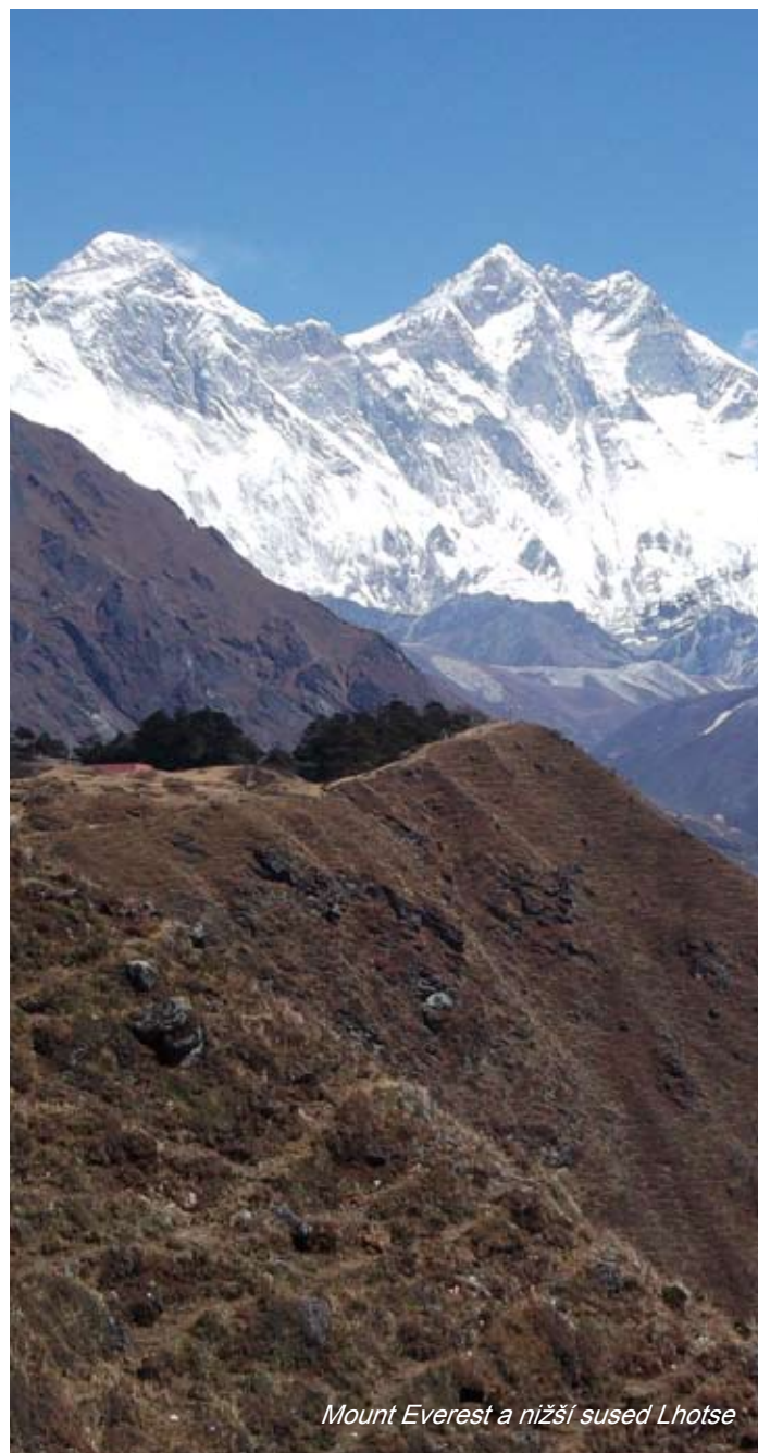
Mount Everest a nižší sused Lhotse

Prílet (Bratislava / Budapešť / Viedeň) a individuálny odchod domov.