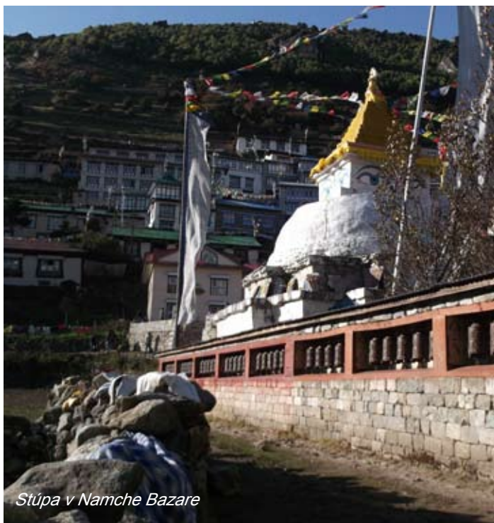
Stúpa v Namche Bazare