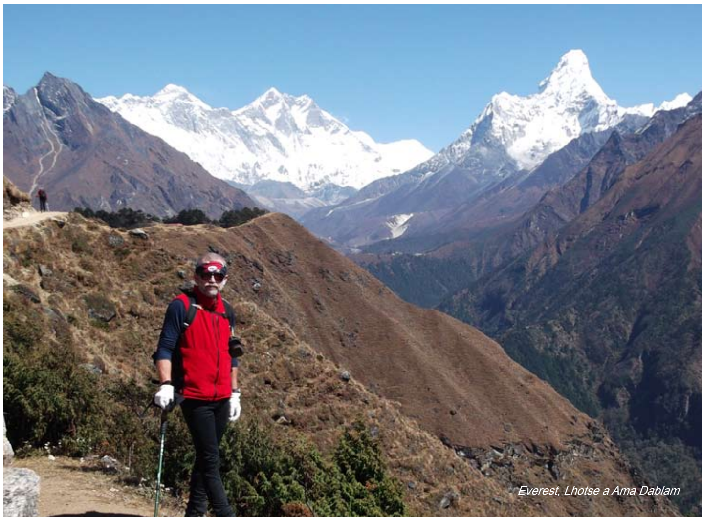
Everest, Lhotse a Ama Dablam

V nižších polohách a v Káthmandu využijeme aj krátke nohavice a tričká s krátkymi rukávmi a sandále alebo tenisky.